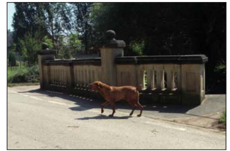
Cifra híd A kutyát sem érdekli???

Ez a program és a környezeti állapot indította az értékmegőrzőket arra, hogy méltó körülményt próbáljon teremteni, hogy az emléktúra résztvevői gondozott állapotokat találjanak. Néhányan neki álltunk és elvégeztük azt, ami egyébként az önkormányzat kötelessége lenne. Aztán befejeztük. Álltunk a hídon, néztük a "Ló" folyó sáros vizét, amint sebesen eltűnik a híd alatt. Az éjszaka eső esett a patak völgyében. A víz felett színes szitakötők táncoltak. Békés nyugalom vett körül bennünket. Visszatért a rend!