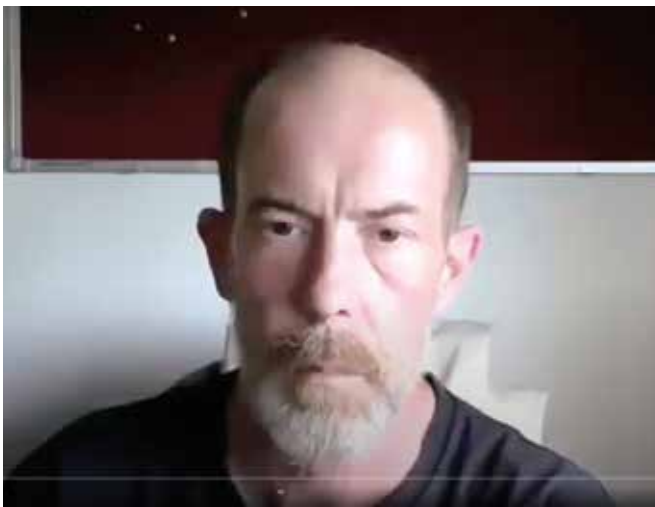
Képünk a Glasgow-ban 2019-ben rendezett konferencián készült

Mai tudásunk szerint 100-ból egy ember autista. Az autizmus világnapja alkalmából Damian Milton elismert brit autizmus kutató beszélt a Mércének a sokasodó autizmus diagnózisok mögötti okokról, folyamatban lévő kutatási irányokról és arról, hol az autista emberek helye a szakemberek és szülők közt. Damian Milton nemcsak kutatja az autizmust, de maga is autista – sőt egyik fia is az.