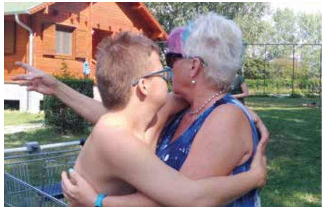
Régi ismerősök, ha találkoznak

„Én így, újságon keresztül is arra kérek mindenkit, próbáljatok kimozdulni, higgyétek el, megéri! Jó lenne már egymást megismerni, és a nevek mögé arcot is kapcsolni.” (Szülői vélemény 2009-ből)