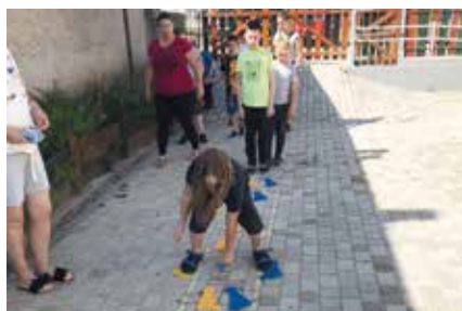
AutiSpektrum Egyesület (Veszprém)