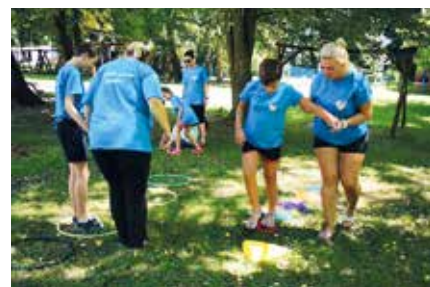
Esőmanók Egyesület (Szekszárd)