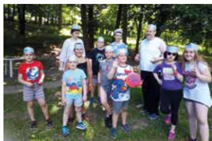
Nógrádi Autizmus Alapítvány (Salgótarján)