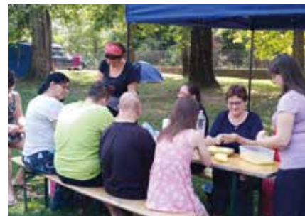
A Szalki-talin készül az ebédre való. Cikkünk a 20. oldalon