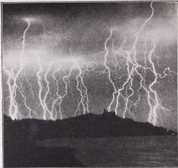
1. kép. Villámok Tihanyban 1928. augusztus 5-én éjjel.