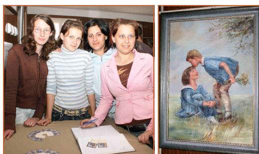
A szakiskolás lányok mindig hálás közönségnek számítanak. Az olajfestmény címe: Első udvarlás