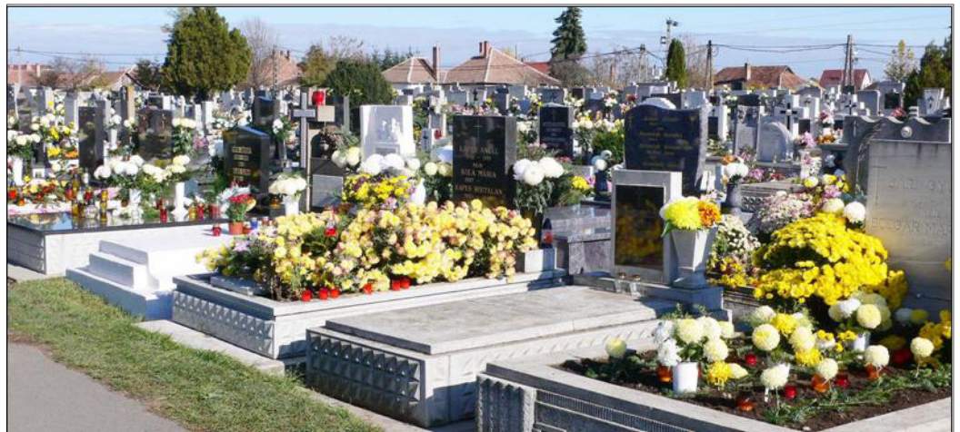
A virágdíszbe öltözött polgári köztemető „Hol sírjaink domborulnak”.

Minden ember életében nem csupán az élők foglalnak el fontos helyet, hanem a holtak is. Ahogyan a