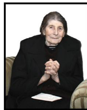
Mencike néni idén tavasszal a parókian