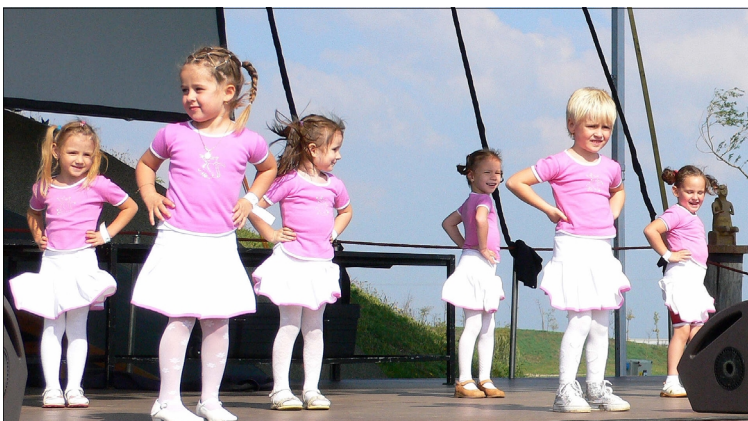
Lámpaláz nélkül lépett fel a képen (csak részben) látható görbeházi „Dyna Táncsoport”

utcáit, hogy kedvet csináljanak a fesztiválon való részvételhez. Dél előtt ünnepi megemlékezést tartottak az Aradi Vértanúk emlékére a vízi színpadon. Főzőverseny, lovas- és kézműves bemutatók, a kistérség művészeti csoportjainak fellépése, operett műsor töltötte ki az első napot, amelynek a fénypontja természetesen a CRYSTAL esti élő koncertje volt. A második napon kézműves foglalkozások, horgászverseny, bábelőadás, Fekete László az ország legerősebb emberének erőbemutatója, a térség legerősebb emberének keresése, lovagi torna, Ilos József humorista műsora, majd a BIKINI élő koncertje szórakoztatta a közönséget. pz.