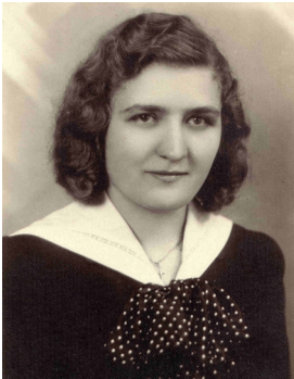
A fotó diplomaosztáskor készült 1942-ben