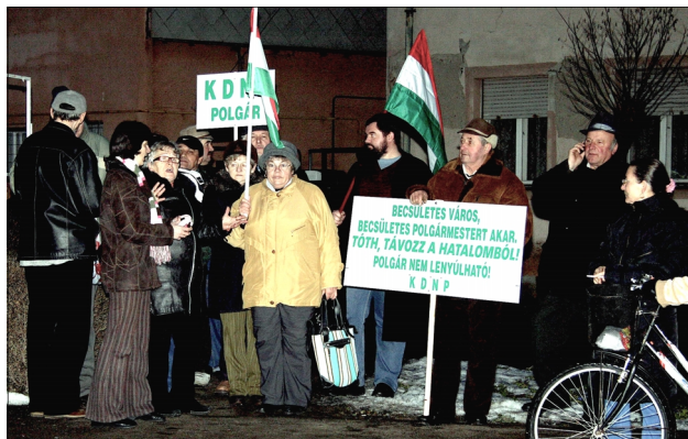
2008. január 17-én délután négy órától, két-háromszáz fős tüntetést tartottak a Panzióval átellenes zöldterületen. Képeink az eseményt idézik.