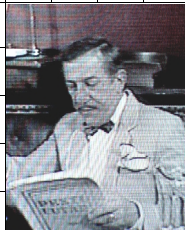
Antal Imre egy tévéjelenetben.

2008 április 15-én elhunyt Antal Imre a magyar tévétörténelem kiemelkedő alakja. Szeretreméltó egyénisége, sokirányú műveltsége, remek humora és nagyszerű színészi alakításai emlékezetesek maradnak mindannyiunk számára. Rejtvenyünkkel életútja előtt tisztelgünk. A vízsz. 1., 13., 20., 29., 89., 95., és a függ. 11., 12., 14., 17., 18., 19., 24., 28., 74. számú sorok helyes megfejtését 2008. július 1-ig (akár Interneten!) beküldők nevét „dicsőséglistánkon” közzé tesszük. (A hosszú és a rövid magánhangzók között nem tettünk különbséget.)