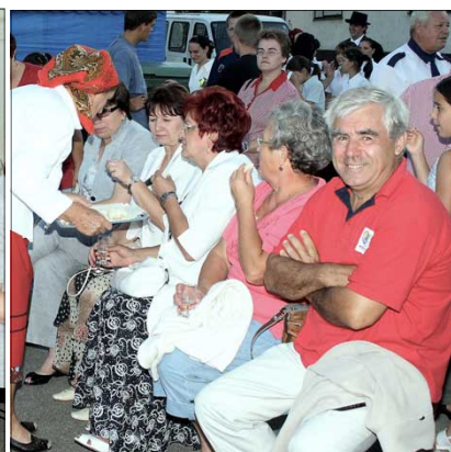
A megáldott, megszentelt és kockákra vágott Új Kenyérrel, meg egy-egy kupica aratópálinkával kínálták körbe a Szent István napi ünnepség résztvevőit.