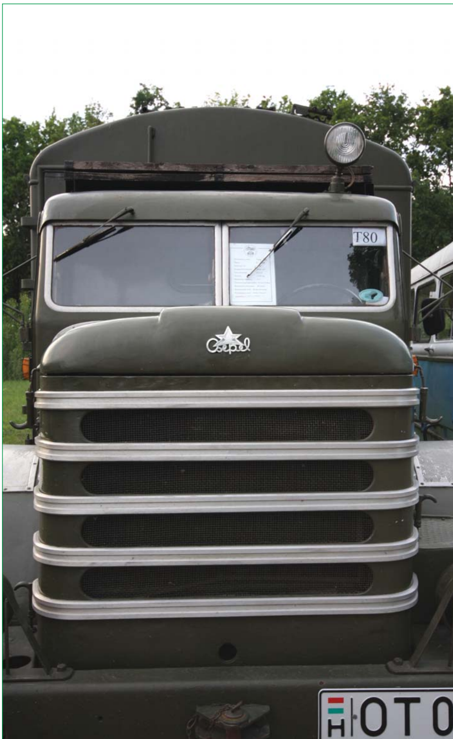
Veterán vendégek Polgáron

2009. július XX. évfolyam 7. szám (219.)