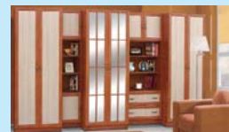
szekrény sorok 42900-tól