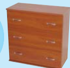
komódok írásztalok 9900-tól