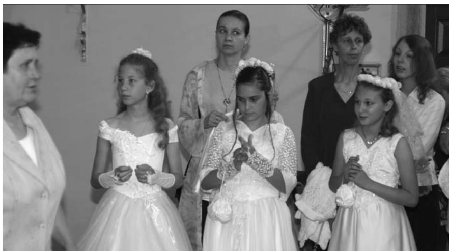
Május 30-án, Szentháromság Vasárnapján került sor Polgáron a fiatal római katolikus hívek elsőáldozására.

Ebben a lelkes polgári hívek virágszöngyeggel díszítetik fel körben a templomukat, valamint elkészítetik a 4 sátrat, ahol az ürnap körmenet halad végig. A virágszöngyegben különböző ábrázolásokat jelenítenek meg, amelyek a mi Urunk, Jézus Krisztus szentséges Testének és Vérének ünnepére emlékeztetnek. A kedves hívek ebben is kifejezik elköteleződésüket és mélységes hitünket az Oltáriszentség iránt.