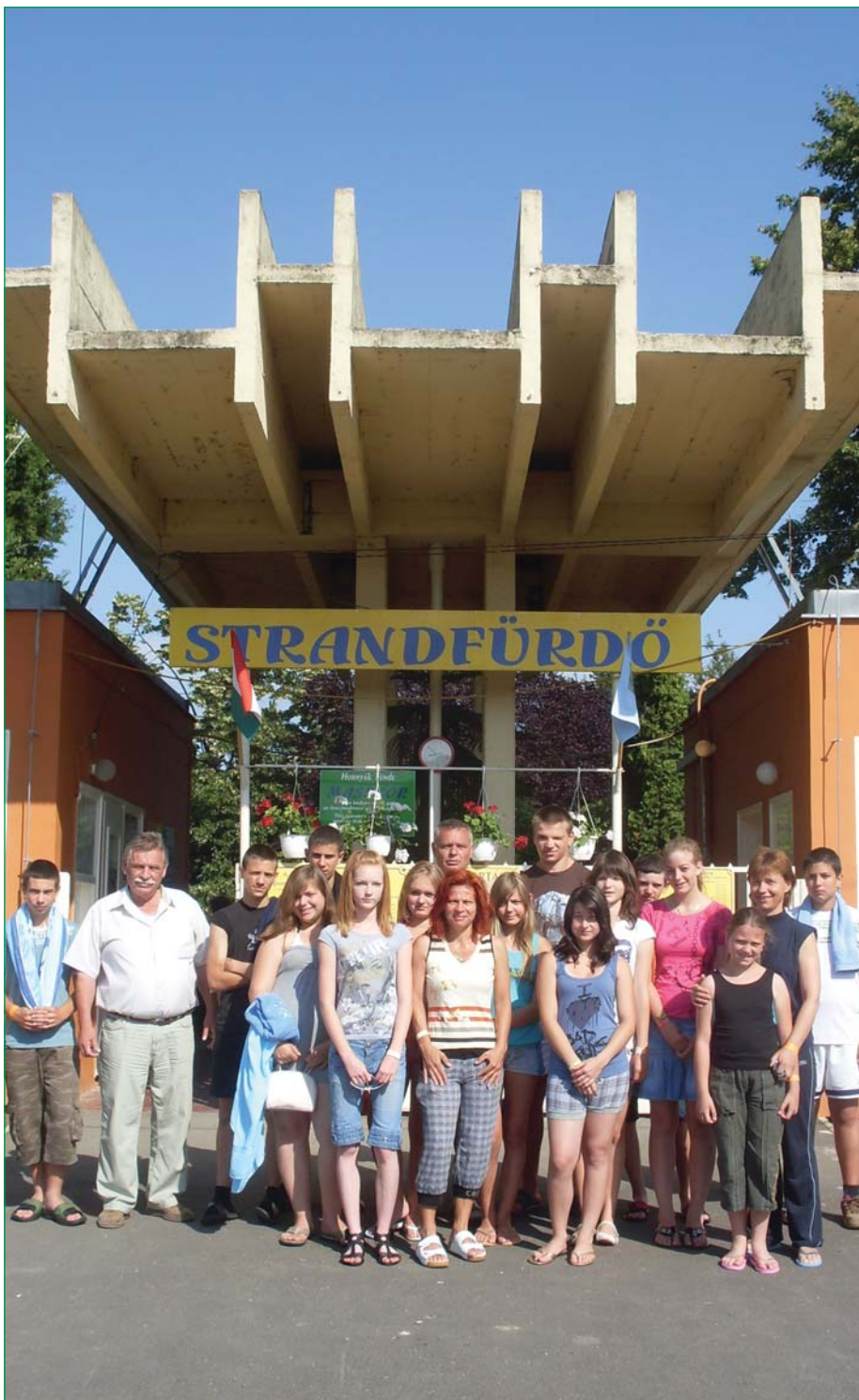
Árvízkárosult gyerekek nyaraltak Polgáron

2010. július XXI. évfolyam 7. szám (231.)