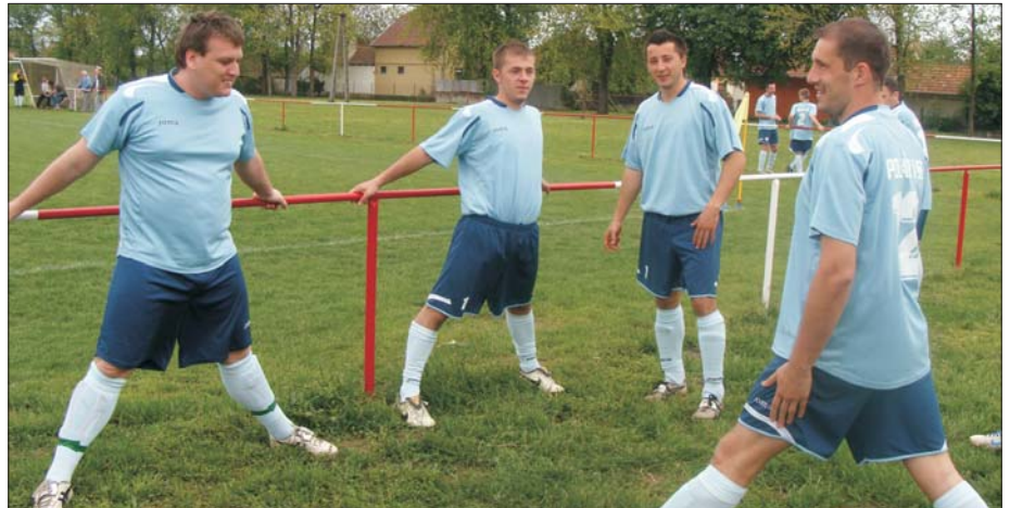
Ki kell húzni magunkat!