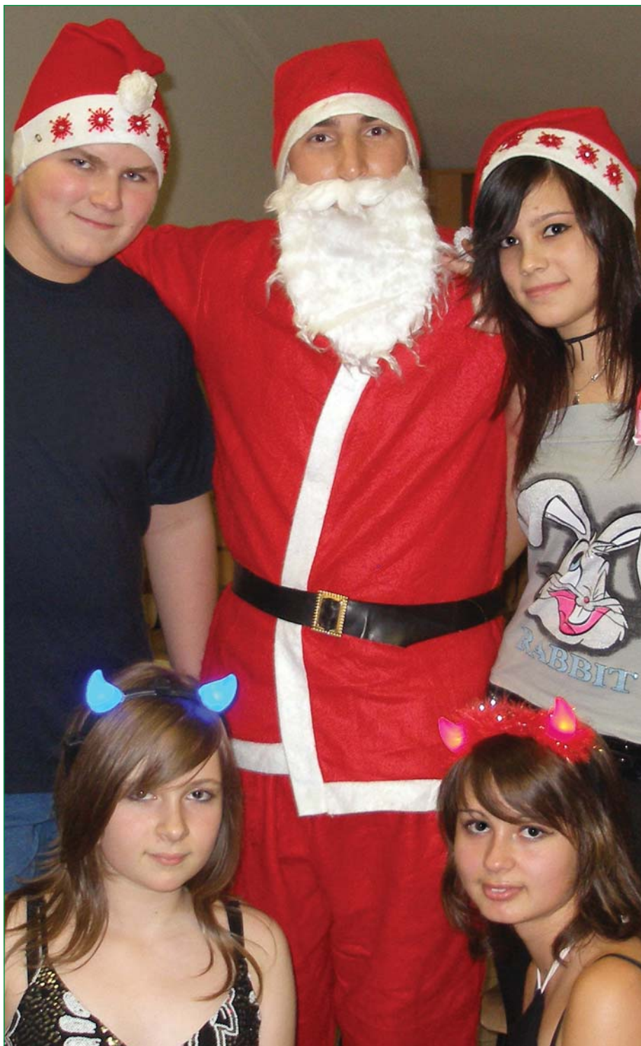
Megjött a Mikulás!

2010. december XXI. évfolyam 12. szám (236.)