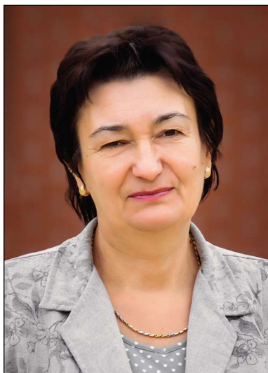
Makó Sándorné Polgár Város Közszolgálatáért-díj