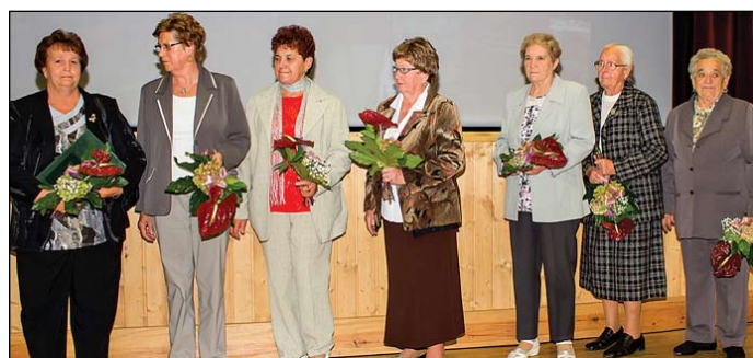
Polgári Foltvarró Kör Lokálpatrióta összefogás-díj