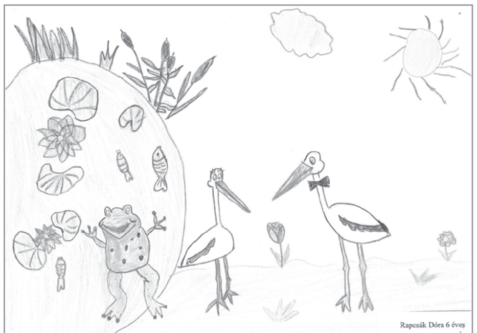
Rapcsák Dóra 6 éves