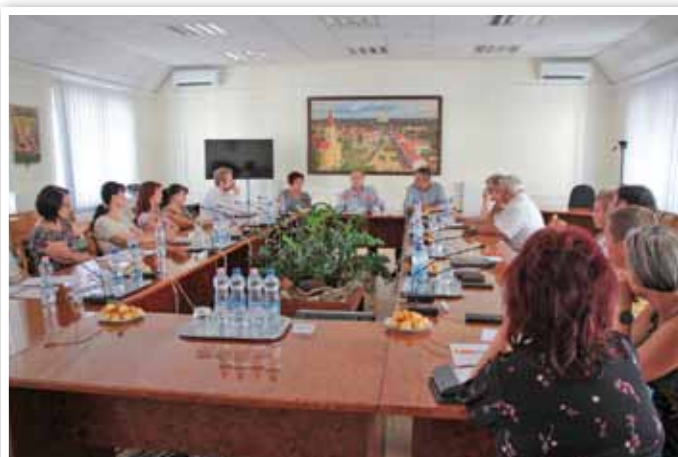
Városunkba látogatott Szapáry György