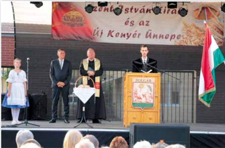
Szent István király és az Új kenyér ünnepe