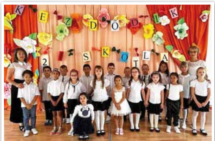
Kezdődik az iskola