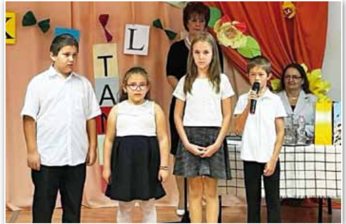
Eredményes 2022/2023-as tanévet kívánunk minden tanulóknak!