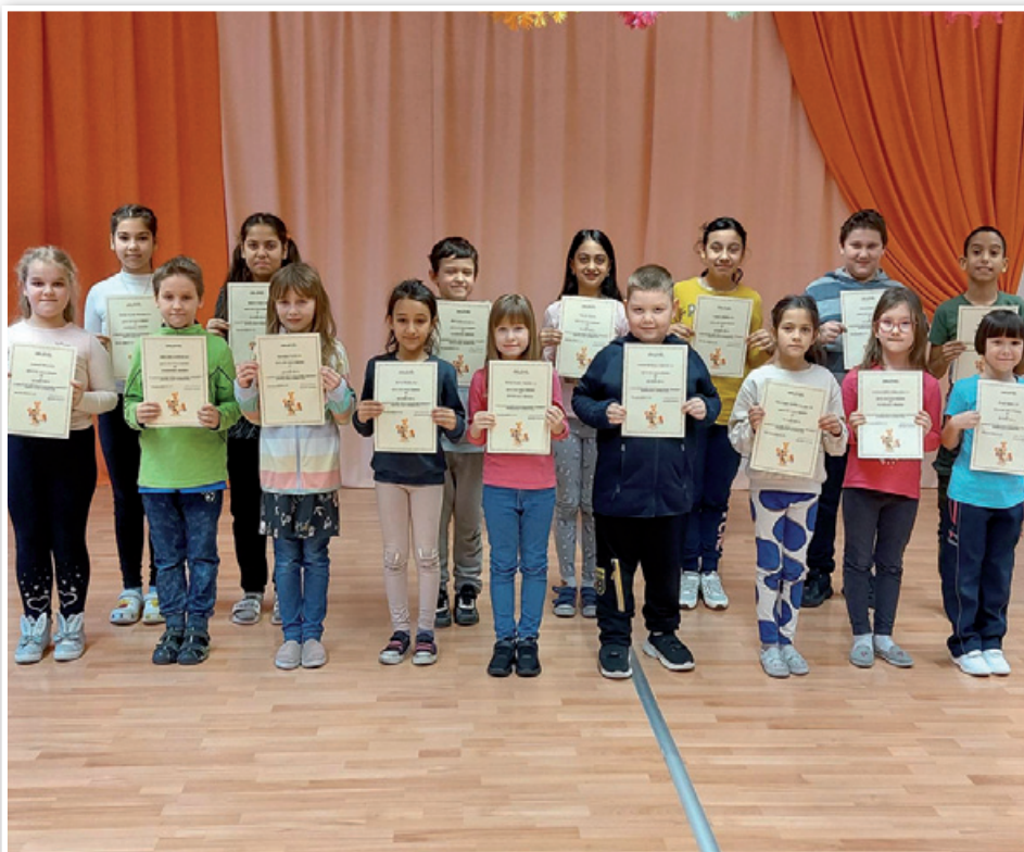
Szépolvásó- és versmondó verseny díjazottjai