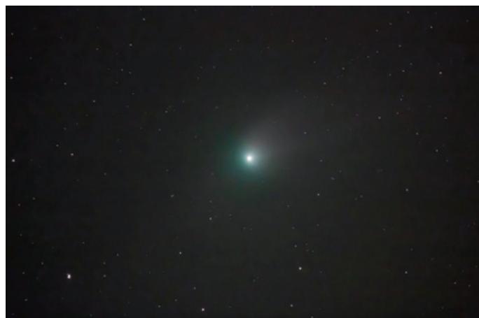
Üstökös Polgár felett

a Vega Csillagászati Egyesület közlése nyomán