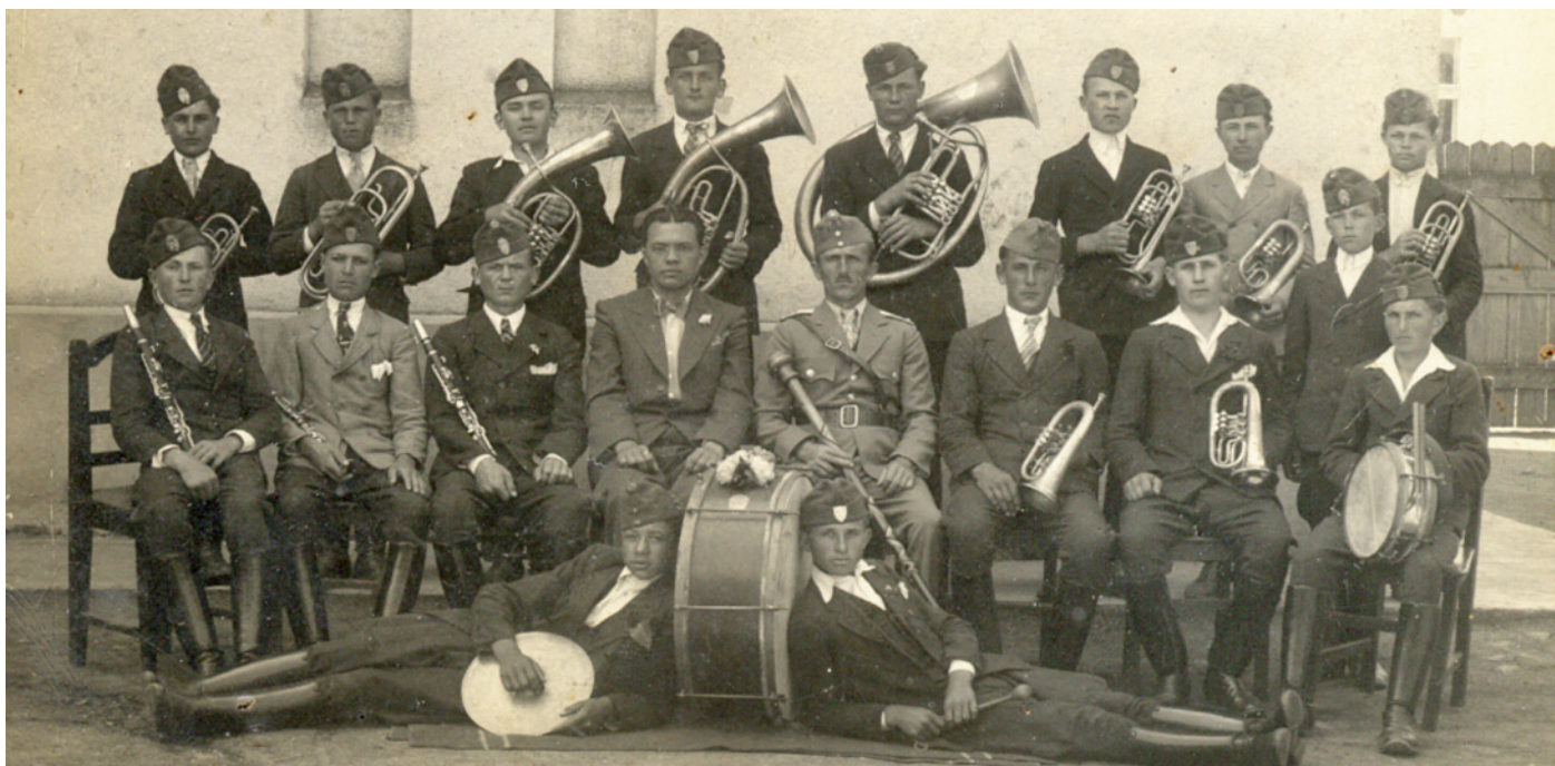
Polgári levente zenekar

Részlet Megyesi József: Polgár város múltja és jelene (2013) című könyvéből