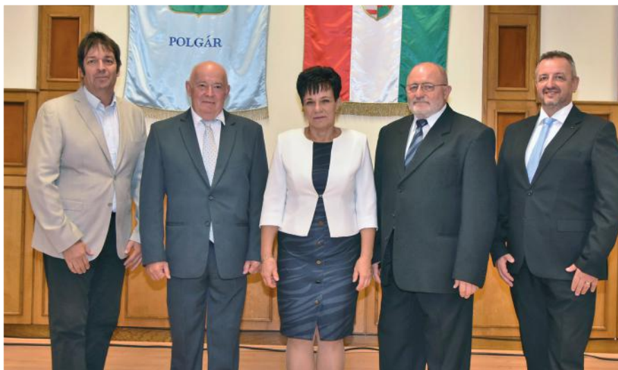
Pénzügyi és gazdasági bizottság