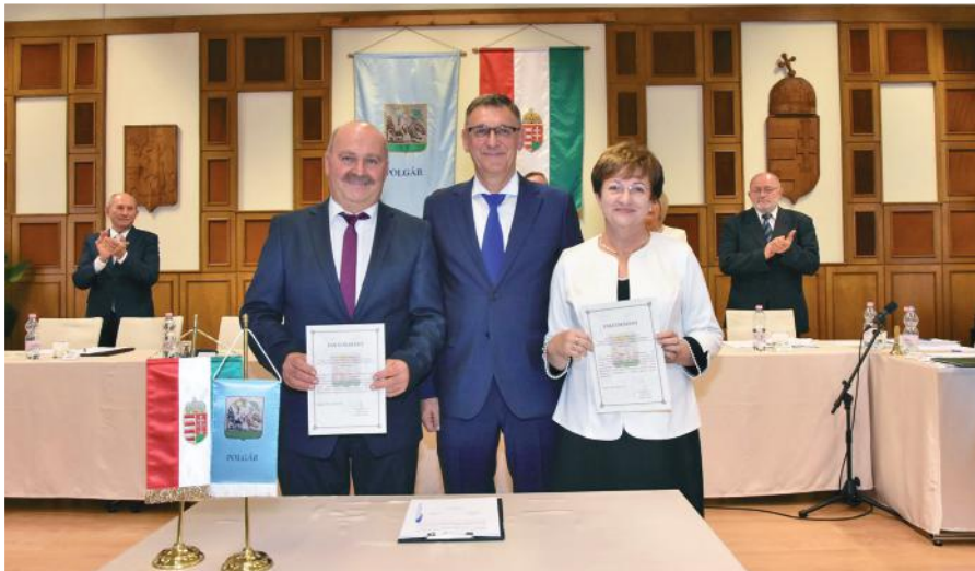
A város vezetői