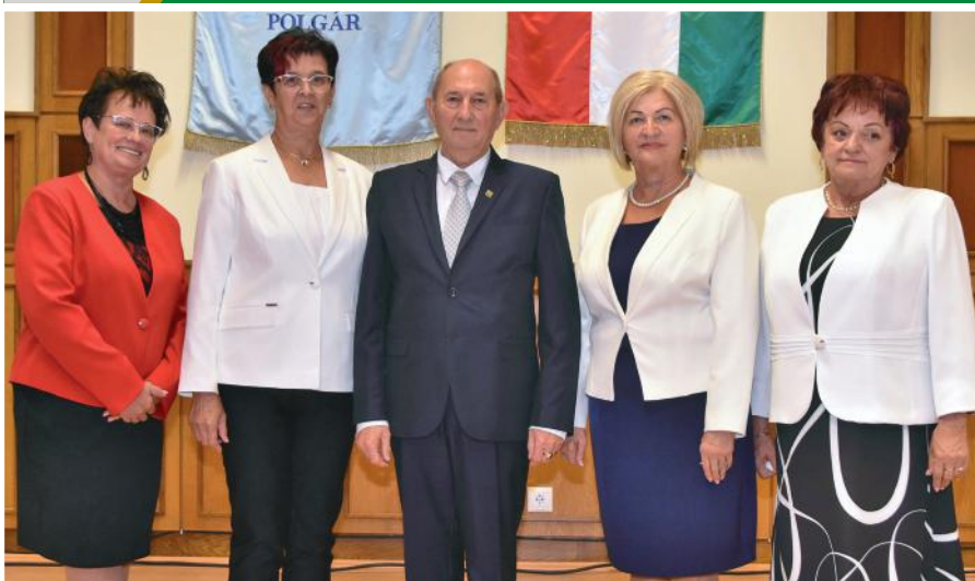
Humánfeladatok és ügyrendi bizottság