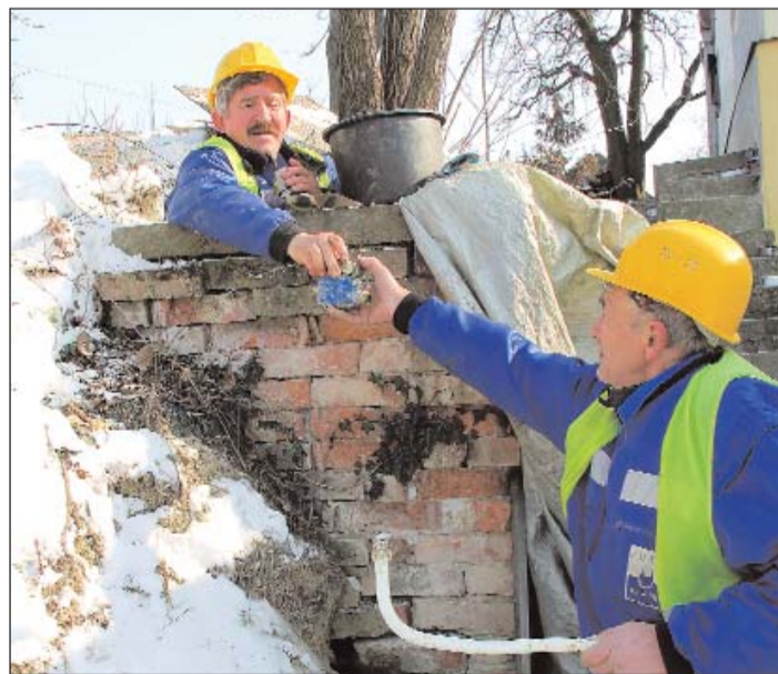
Megfelelő védelemmel elkerülhető a vízmérő elfagyásából következő anyagi kár.

A Zalavíz Zrt. partner a rezsicsökkentésben, így a jövőben is rendszeres tájékoztatást nyújt Fogyasztóinak, hogy milyen intézkedésekkel érhetnek el további megtakarításokat vízdíjszámlájukban.