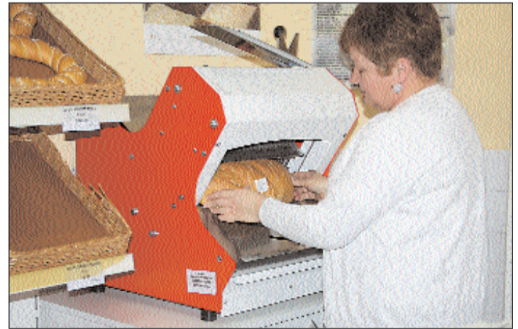
Új kenyérszeletelő berendezés a Pékemester pacsai boltjában.

2014 az átalakulás és felkészülés éve lesz a következő, 2014–2020 közötti programozási időszakra, melynek fókuszában a munkahelyteremtés és a gazdaságfejlesztés áll.