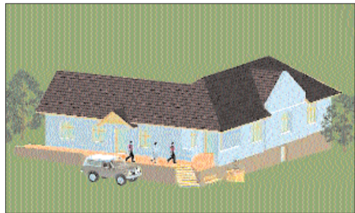
A helyi termékbolt látványterve.

— Az állam által kiemelten fontos területen, a fiatalok sportolását támogató fejlesztések igénybe vételével újulhatott meg a sportcentrumban a füves centerpálya.