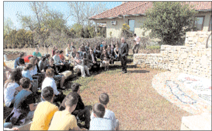
Találkozó az ökoparkban.

nénk létrehozni cserszegi fűszeres elnevezéssel, Bakonyi Károly szőlőnemesítő előtt is tisztelve egy szép közösségi teret a cserszegi falurészen. Az itt kialakítandó pihenőparkban nemcsak a helyiek, hanem a gyalogos és kerékpáros turisták is időzhetnek. Ez évi feladataink közé tartozik még, hogy unafalakat létesítsünk a temetőben, további kőkereszteket újítsunk fel, és fix alapot készítsünk a rendezvénysátorok a sportcentrumban. Ez utóbbit társadalmi munkában végzi