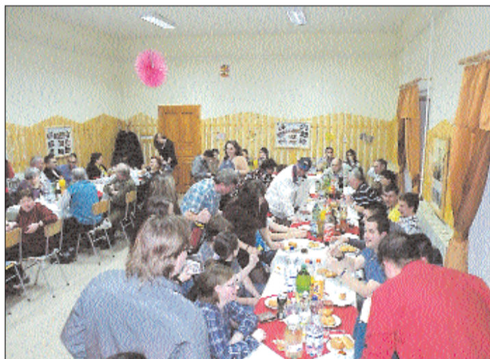
Civil szervezetek estéje...

ink hagyományá növekedett ki magukat, melyek szerves részei a helyi közösség életének.