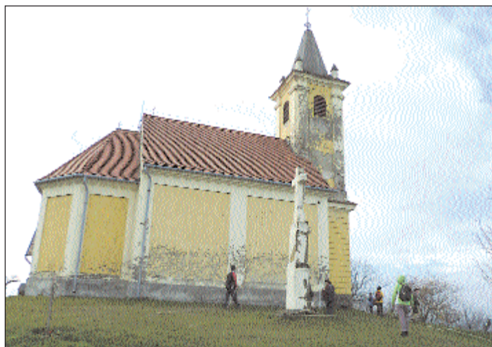
Korábbi felvétel a kemendi kápolnáról, amit felújítanak.

Civil szervezetekről szólna, örülünk annak is, hogy az elmúlt évben újjászerveződött a sportegyesület, melynek tagjai lelkesen kapcsolódtak be a munkába. Meg kell említenem fiataljaink tánc csoportját, az őket kísérő szülőket, anyukákat, akik fellépéseikkel várásznak jó hangulatot, s rajtuk kívül vöröskeresztes alapszervezetünk és önkéntes tűzoltó egyesületünk tagjait, akik munkájukkal, ötleteikkel szintén hozzájárulnak rendezvényeink sikeréhez. Településünk életében fontos szerepet tölt be a falugondnoki szolgálat. Korábbi falugondnokunk nyugdíjba vonult, ezért a művelődési ház vezetője látja el ezt a feladatot is, amit mindenki meglepedésére végez. Közművelődési munkájába besegít a korábbi falugondnok és a civil szervezetek tagjai. Elért eredményeinkben nagy szerepet játszott a mindenkor képviselő-testület, a kezdeti nehézségeken túljutva, az összefogásról, az egyetértésben végzett produktív munkáról mutattak példát a lakosoknak. Nincs nagyobb ajándék, mint amit az elmúlt másfél évtizedben az összefogás hozott a falu közösségének – hangsúlyozta Koroncz László.