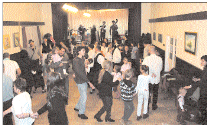
Sok érdeklődőt vonzott a táncház.

– Cserszegtomaj ugyan családi házas övezet, mégis úgy gondoltuk, lehetőséget teremtünk a közösségi együttélésre. Ennek érdekében hoztuk létre jelentős pályázati támogatással az óvodától mintegy száz méterre található ökoparkot, ahol a családok, az emberek találkozhatnak egymással. A gyógytorny- és fűvészkert kihelyezett óvodai foglalkozások és iskolai tanórák helyszíne is egyben. Úgy vélem, az önkormányzati terület