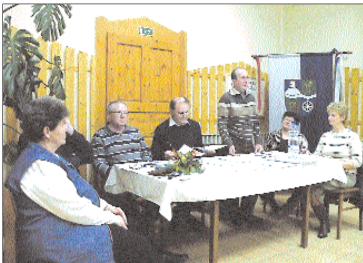
Közmeghallgatáson értékelték az elmúlt évet.

dés okozta károsodástól. A kápolnától gyönyörű kilátás nyílik, az esti órákban csodálatos látványt nyújt Zalaegerszeg közvilágítása, látni az ebergényi, baziltai, másik irányban a nagypáli és egervári hegyvonulatot, sőt a Balaton irányában is látszanak a fények. A másik műemlékünk az 1700-as