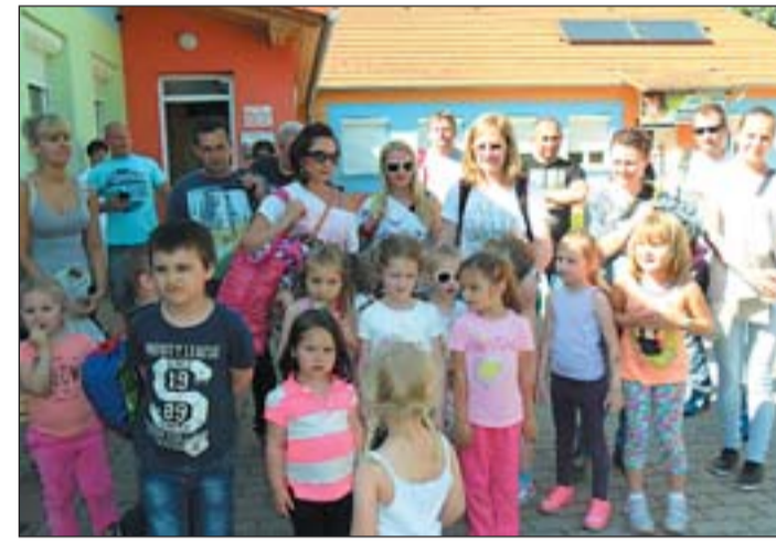
Soproni ovisokat láttak vendégül.