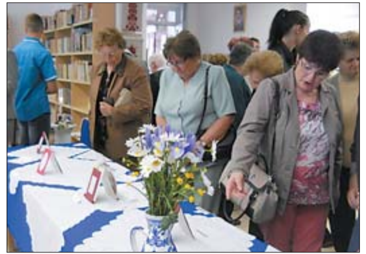
Kiállítás a hímszakkör munkáiból.

Július 3-án kaptuk kézhez a pénzügyi felügyelet megszűnését tartalmazó végzést, ami a Magyar Közlönyben is megjelent. Hogyan tovább? – a kérdés megválaszolására hamarosan rendkívüli testületi ülést fogunk összehívni, melyen meghatározzuk jövőbeli feladatainkat. Erőn felül nem vállalunk semmit, de vannak feladatok, amiket meg kell oldanunk. Ilyen az iskola melletti betontörmelék elszállítása, a terület rendezése. Szeretnénk folytatni az utak, járdák rekonstrukcióját, ehhez pályázati