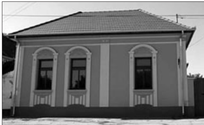
A felújított épület utcai homlokzata