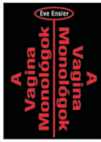
A VAGINA MONOLÓGOK

A meghirdetett 4 előadásból 3 kerül bemutatásra!