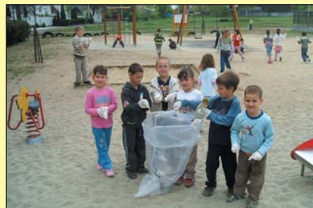
A IV. Sz. Napközi Otthonos Óvoda Ifjúság úti intézményének Kisvakond nagycsoportosai

Bár ez az akciónk csak egy csepp a tengerben, de büszkék vagyunk rá, és biztatunk mindenkit, hogy minél többen kövessék példánkat!