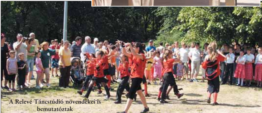
A Relevé Táncstúdió növendékei is bemutítottak