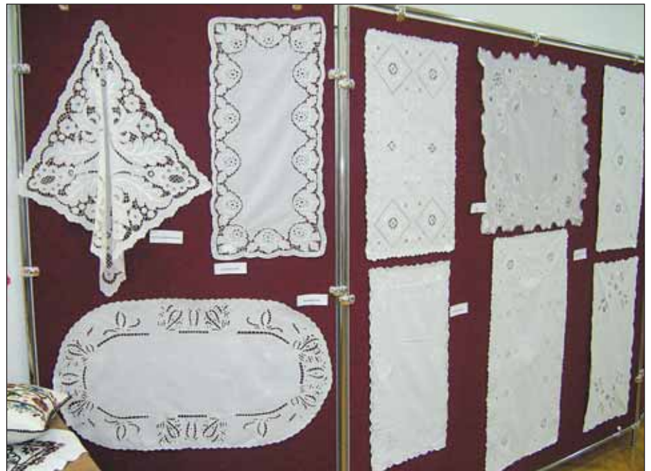
Részlet a kiállításból