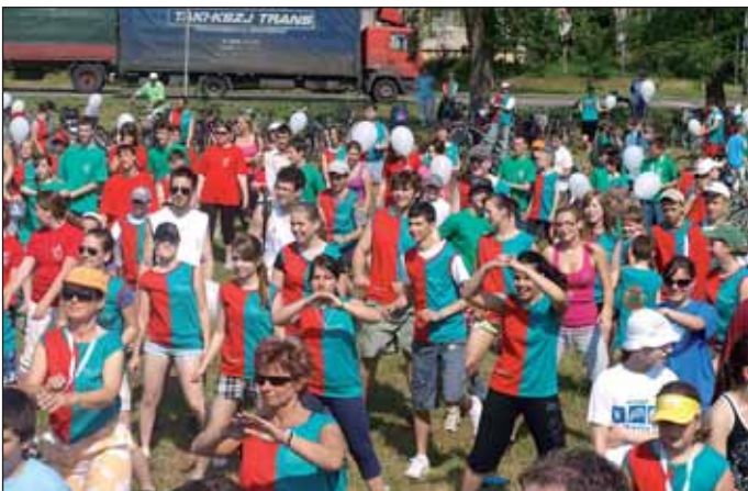
A testmozgás elengedhetetlen az egészségünk megóvása érdekében – hangzott el a világbajnoktól