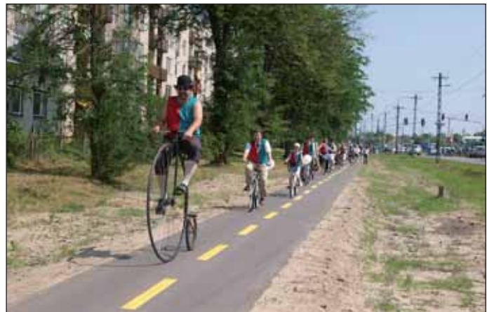
Többszázan tekertek együtt a Nagykőrös–Kecskemét közötti kerékpárúton