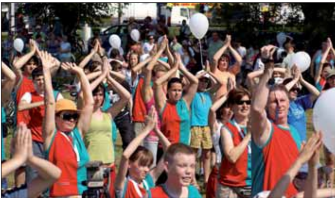
A kerékpározás előtt több százan csatlakoztak a bemelegítéshez