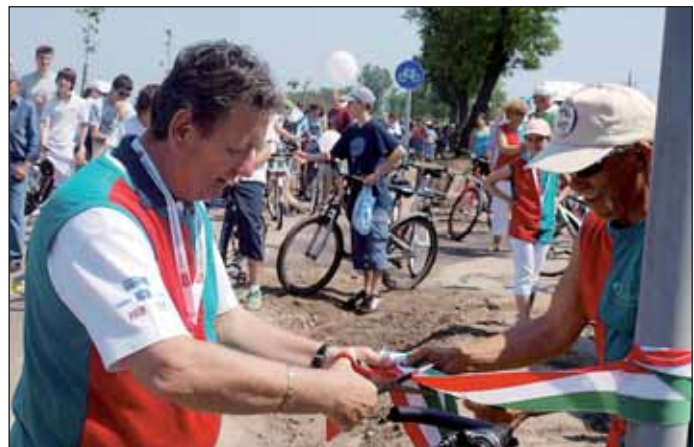
A kerékpárút ünnepélyes átadása