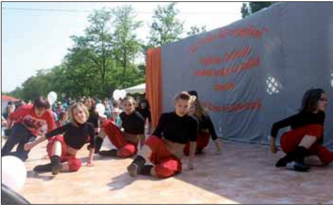
A RELEVÉ TSE Exotic Táncsoport bemutatója is színesítette a programokat