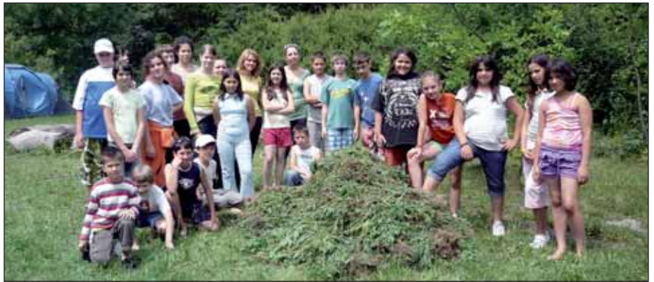
Egy ilyen csapattal szemben esélye sem volt a parlagfűnek!

Ebben az esős évben nem csak a facsemeték nőttek az erdőn, hanem a parlagfű is a tanösvény mentén. Csapatunk szorgos munkájának eredményeként majd 25 000 szálát sikerült begyűjteni a tábor környékéről. Az összegyűlt zöldhulladékot a KÓVA Zrt. dolgozói szállították el a komposztálóba.