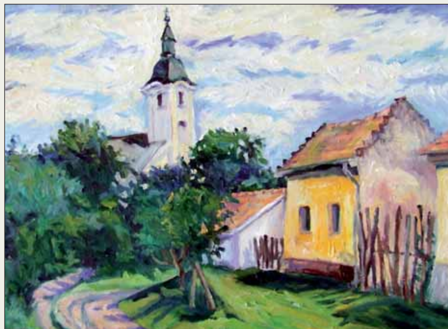
Alpári templom (olaj)