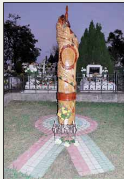
Az aradi vértanúk emlékére (Törtel)