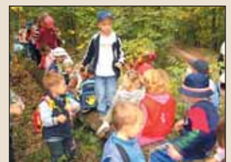
A Kazinczy úti óvodások Pálfájai kiránduláson