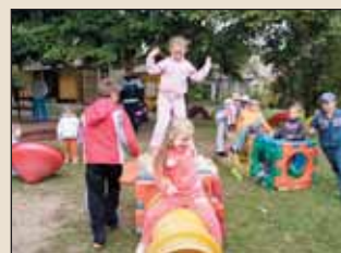
Az Eötvös úti óvoda sportnapján

Szeretettel várunk előzetes ismerkedésre minden érdeklődőt óvodánkba.