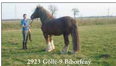
2923 Gölle-9 Bíborfény

Nagykőrösön 1992 óta a jelenlegi Nagykőrösi Lovas Sportegyesület telephelyén található a Fedezőmén Állomás, melynek a XX. század első felében a ma múzeumként funkcionáló akkori Méneskari laktanya (a köznyelv ismerete szerint: Csödörös laktanya) volt a telephelye.