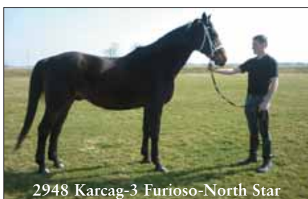
2948 Karcag-3 Furioso-North Star

Nagykőrösi Lovas Sportegyesület 2750 Nagykőrös, Vízállás-Gátér-dűlő 10. 06-20/342-3144 www.nlse.hu