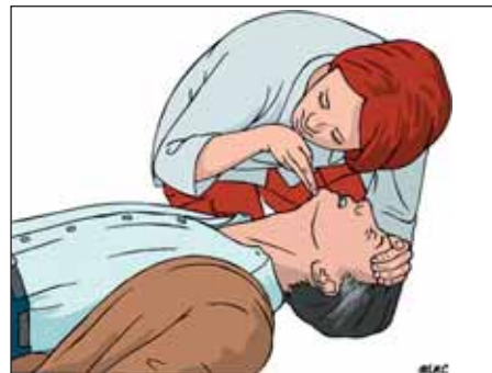
Légzés és keringés vizsgálata