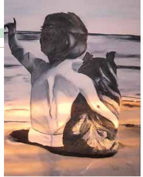
Szabadság, 60x80, olaj