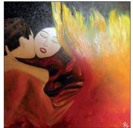
Szerelmes lángolás, 70x70, olaj