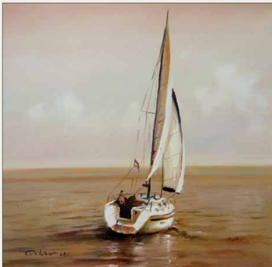
Balatoni vitorlás – olaj, vászon, 40x40 cm