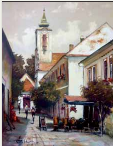
Szentendre főtere – olaj, vászon, 60x40 cm

Kiállításai a teljesség igénye nélkül: 2000 Nagykőrös; 2001 Kecskemét, Cegléd, Solt; 2002 Törökszentmiklós, Budapest, Szabadszállás; 2003 Székesfehérvár, Debrecen; 2004 Szeged; 2005 Pécs; 2006 Nyíregyháza; 2007 Miskolc; 2009–2010 Budapest.