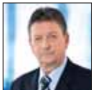
DR. CZIRA SZABOLCS polgármester és országgyűlési képviselő

2011. július 7. (csütörtök) 13.00 órától Helye: Nagykőrös Város Önkormányzat Polgármesteri Hivatal (Nagykőrös, Szabadság tér 5. fszt. 12. szoba)