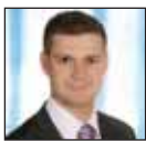
DR. KÖRTVÉLYESI ATTILA alpolgármester

2011. július 7. (csütörtök) 13.00 órától Helye: Nagykőrös Város Önkormányzat Polgármesteri Hivatal (Nagykőrös, Szabadság tér 5. fszt. 12. szoba)