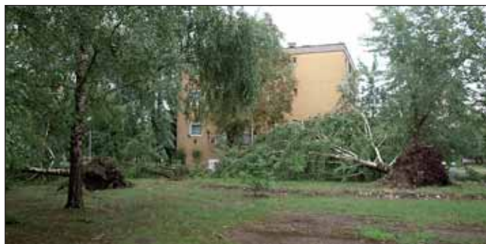
Az Október 23-a téren is fák dőltek ki