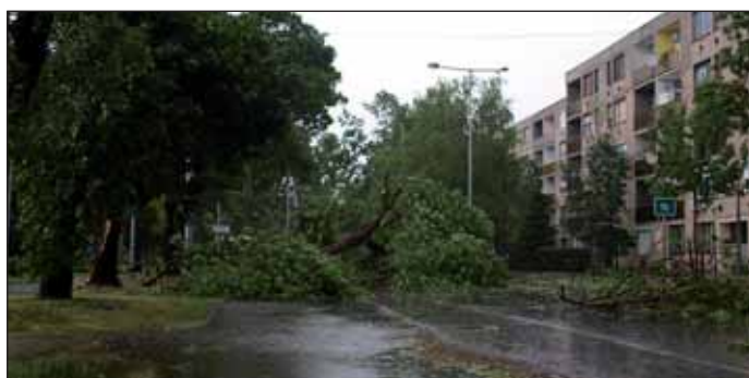
Fák dőltek a Ceglédi útra

Mikor július 19-én hajnalban hatalmas vihar söpört végig városunkon megtépzott fákat hagyva maga után. Azt hittük, ettől rosszabb már nem lehet. Aztán jött a szerda, és alig félóra alatt az egész város területén pusztítás sepegt végig. Tövestül kicsavart és derékba tört fák és megtépzott épülettetők, kidőlt oszlopok mindenhol. A teljes kárfelmérés jelenleg is folyik, annak eredményéről későbbi lapszámunkban tájékoztatjuk Tisztelt Olvasóinkat. Tekintse meg a vihar okozta károkról készült képgalériánkat, illetve annak bővebb változatát keresse a www.nagykoros.hu-n .