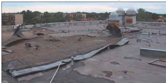
A Petőfi iskola tetejét is megromgálta a szél