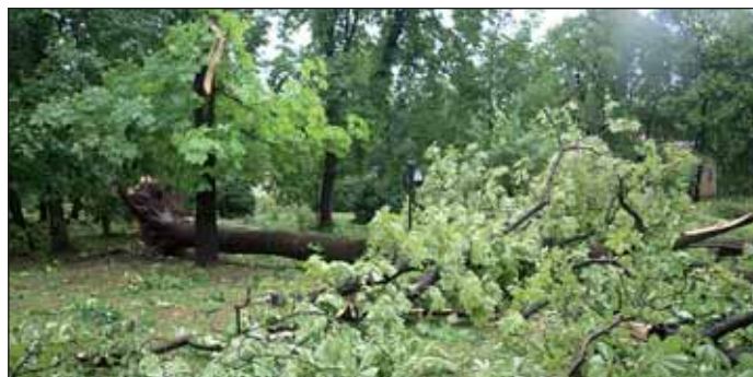
A Cifrakertben is pusztított a vihar