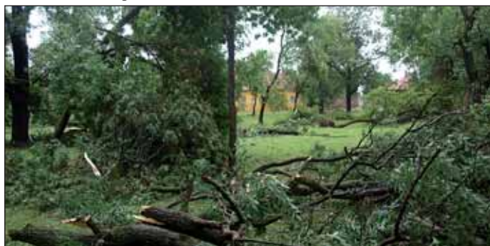
Kidőlt, összetört fák az Arany János Múzeum előtti parkban