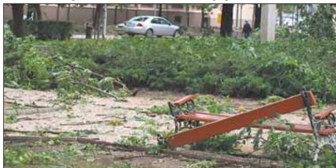
A városközpontot sem kímélte a vihar