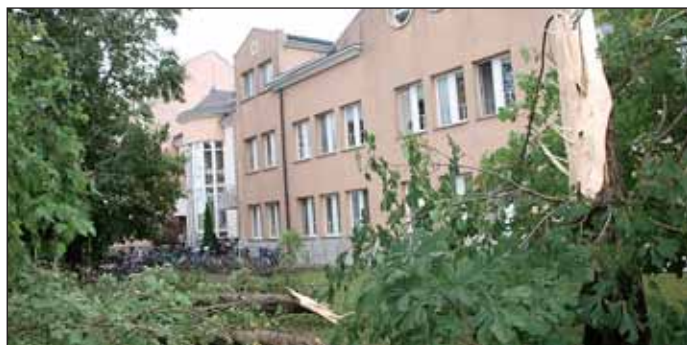
A kórháznál is pusztított a szél, kidőlt fák, megtépett tető