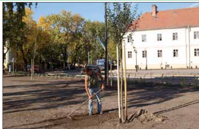
Több mint 120 fát ültetnek ki a városközpont megújítása során