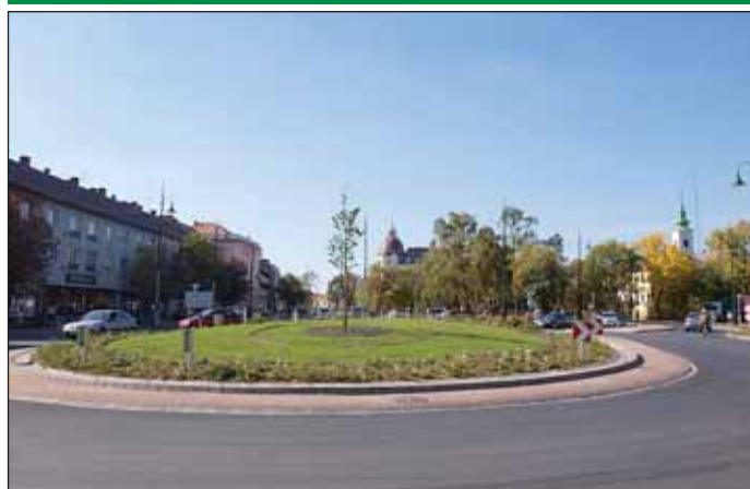
Már zöldell a fű a biztonságos körforgalom közepén