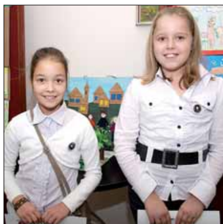
A díjakat dr. Czira Szabolcs polgármester adta át