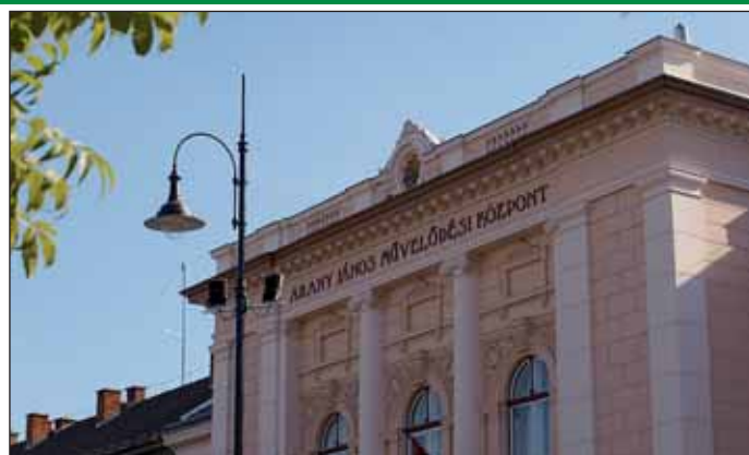
Több mint 20 reflektor fogja megvilágítani a városközpont arculatát meghatározó épületeket