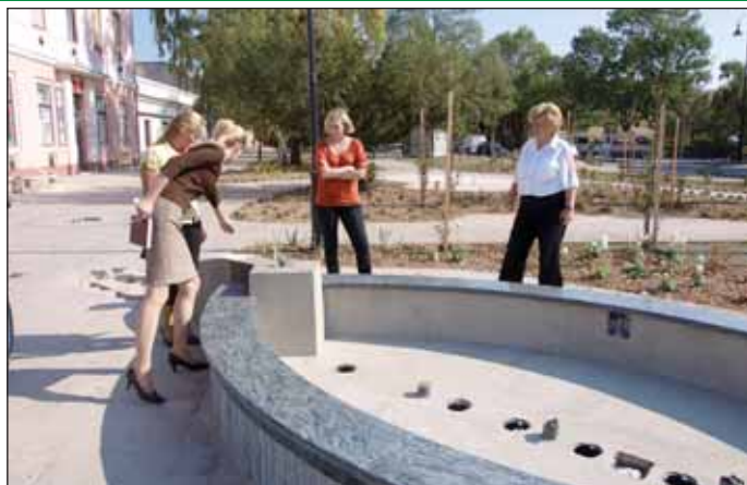
Előtérben a készülő békás szökőkút