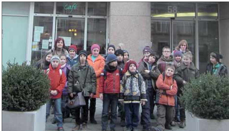
Az Arany János Református Általános Iskola német nyelvet tanuló csoportja a Goethe Intézet előtt

Iskolánk nyelvi munkaközössége arra törekszik, hogy ne egyszerűen tanulják, hanem magukénak is érezzék az elsajátítandó idegen nyelvet a ránk bízott gyerekek. Idén már a suliváró foglalkozások között is szerepelt német nyelvű játékos, zenés, mozgásos óra. A kis óvodások bábokat kaptak a kezükbe, hogy az anyanyelven túli első kalandjaik élményszerűek, szórakoztatóak legyenek.