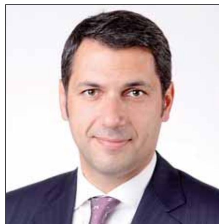
Dr. Lázár János

Dr. Lázár János, a Fidesz-MPSZ frakcióvezetője támogatja, hogy Nagykőrös járásközpont legyen