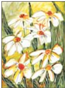
(Patkós Győző alkotása)

Ha ügyes vagy, naponta egy tűzzománcot el tudsz készíteni! Az elkészült remekműveket a kiértékelés után hazaviheted!