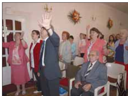
Isten dicsőítése közben

Ezenkívül Isten ígérete és a Biblia szerint próbálunk segíteni a minket megkereső embereknek, akik szívesen megosztják velünk gondjaikat. Szemünkben minden ember egyenlő, hisz mind Istenhez tartozunk, és Isten előtt mindnyájan egyenlők vagyunk szeretett gyermekeiként. A hit egységet kell, hogy teremtsen bennünk. Isten Szent Szelleme által akar alakítani minket Nagykörösiön és az egész világon. Attól válunk istenhívó emberré, ha megcselekedjük az Ő akaratát. Ha Isten szeretjük, akkor egymást is szeretnünk kell. Rendezvényeinken is próbálunk minél többet beszélgetni, úgymond bizonyosságot mondunk