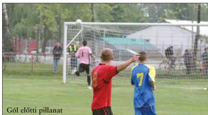
Gól előtti pillanat