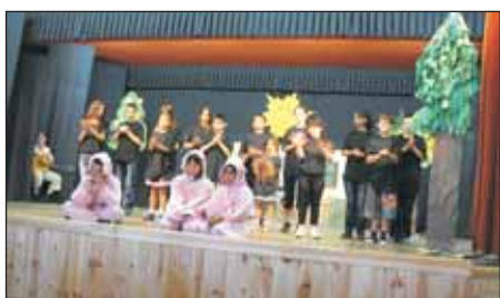
Az előadás záróképe

Negyedik alkalommal hirdette meg az országos gyermek művészeti fesztivált a Kálmán Lajos Óvoda, Általános Iskola és Művelődési Ház Hetényegyházi Művelődési Háza és a Webszínház. A Dalmady Győző Óvoda, Általános Iskola és Egységes Gyógypedagógiai Módszertani Intézmény 21 diákját felvonultató darabjával, „A három kismalac és a farkas” cí-