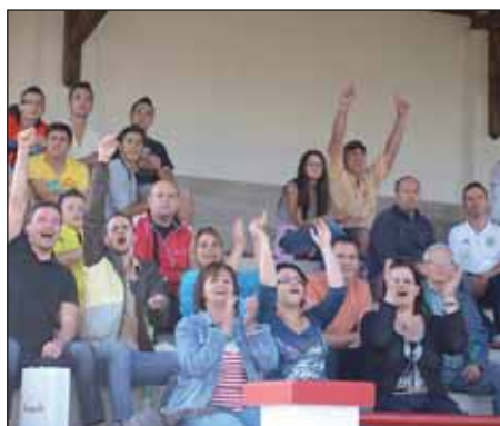
A 100. gólnál nagy volt az öröm

Hazai pályán játszott 2012. június 2-án 17 órától az NK Kinizsi TL FC csapata a Veregyház VSK ellen. A lelkes szurkolókat és játékosokat nemcsak a visszavágás fűtötte, hanem a 100. gól megszületésének reménye is. A fiúk ősszel Veregyház csapata ellen egyszer kikaptak, így már nagyon érett a visszavágó. Játékosaink ezen a meccsen sem okoztak csalódást, hiszen 5:0-ra (féldő: 1:0) nyerték meg a fordulót, és az itt lőtt gólokkal együtt immár 100 fölé került a szerzett gólok száma az idei bajnokságban.