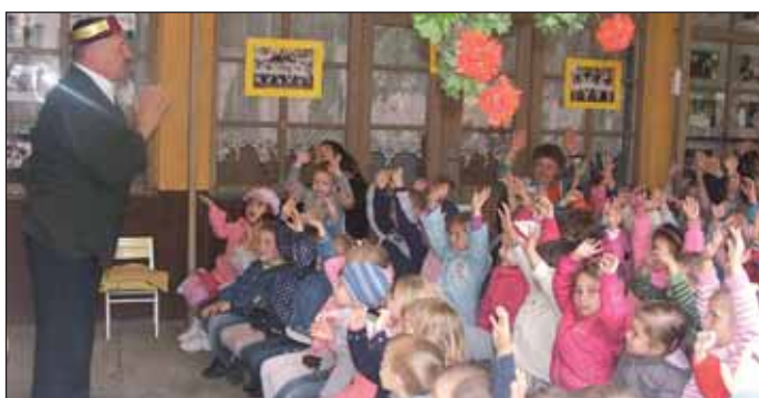
A Ciróka Bábszínház előadása a gyermeknapon