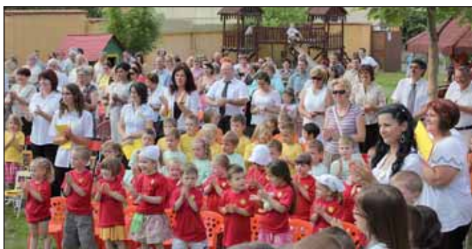
A gyerekek közösen imádkoztak a püspök atyával a szabadtéri hálaadó szentmisén