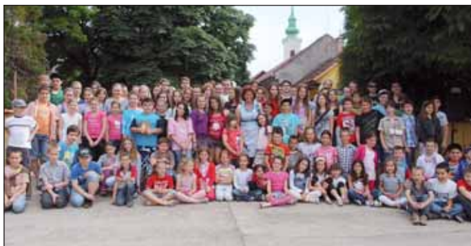
Régi óvodások találkozásán készült csoportkép