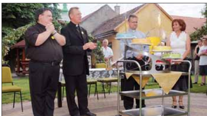
A Názáret óvodás gyermekek 5 emeletes tortát kaptak ajándékba