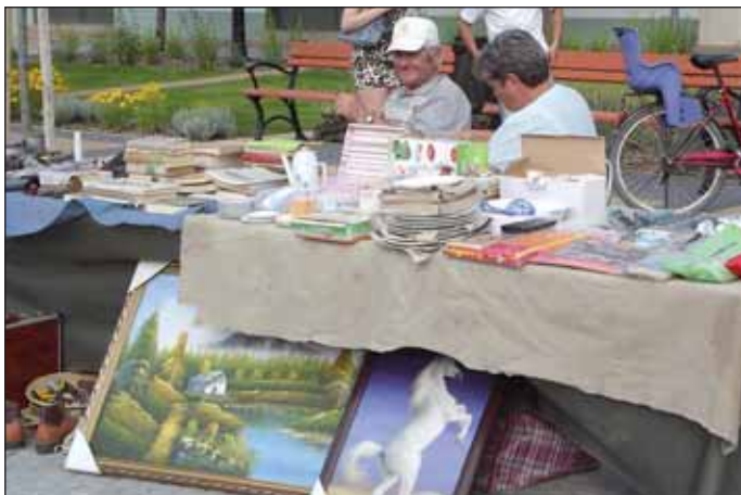
2012. június 9. Öreg krumpli, nem vén krumpli – régimódi vásár

Nagyon tetszik, hogy a családok jól érzik magukat. Jó érzés látni, hogy a picik és nagyok együtt játszottak a Deák téren.