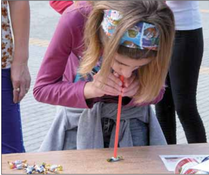
2012. május 19. Sportol a család

2012. május 12-én indította az Arany János Kulturális Központ a Térélmény című programsorozatot. A rendezvénysorozat első programja a Madarak és fák napja volt. Az érdeklődőket madártótó, Sápi Mária környezeti nevelő előadása, fecske- és madárfészek-készítés és a II. Rákóczi Ferenc Általános Iskola 2. a osztályának előadása várta. Május 19-én és június 16-án Sportol a család címmel szórakoztató játékok várták a nagykőrösi családokat a Deák téren. A kilátogatók nagyon jól érezték magukat, élvezték a játékokat. A résztvevők cukrokat és lufikat kaptak ajándéka. A legjobbak, akik színt minden játékot teljesítettek, oklevelet vihettek haza. Június 9-én Öreg krumpli, nem vén krumpli címmel krumplinyomoda, krumplifaragó verseny, krumplikugli és régimódi vásár biztosította a közönség szórakoztatását. A rendezvényekre ki-