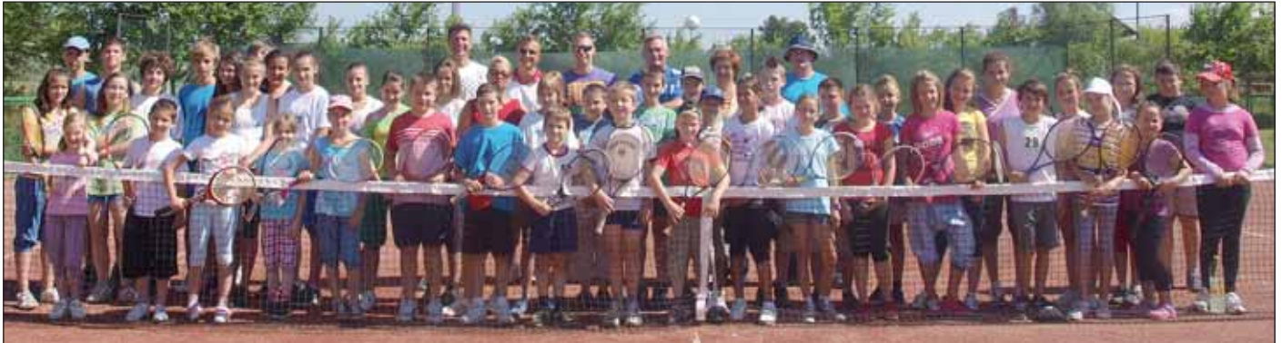
Képünkön a Petőfi és Kossuth iskolás gyermekek és nevelőik a Petőfi Tenisz Sport Egyesület táborában

A Petőfi Tenisz és Sport Egyesület 2011. július 1-jétől kezdte el Nagykőrösön a TAMOP-3.2.11-es pályázat által támogatott programját.