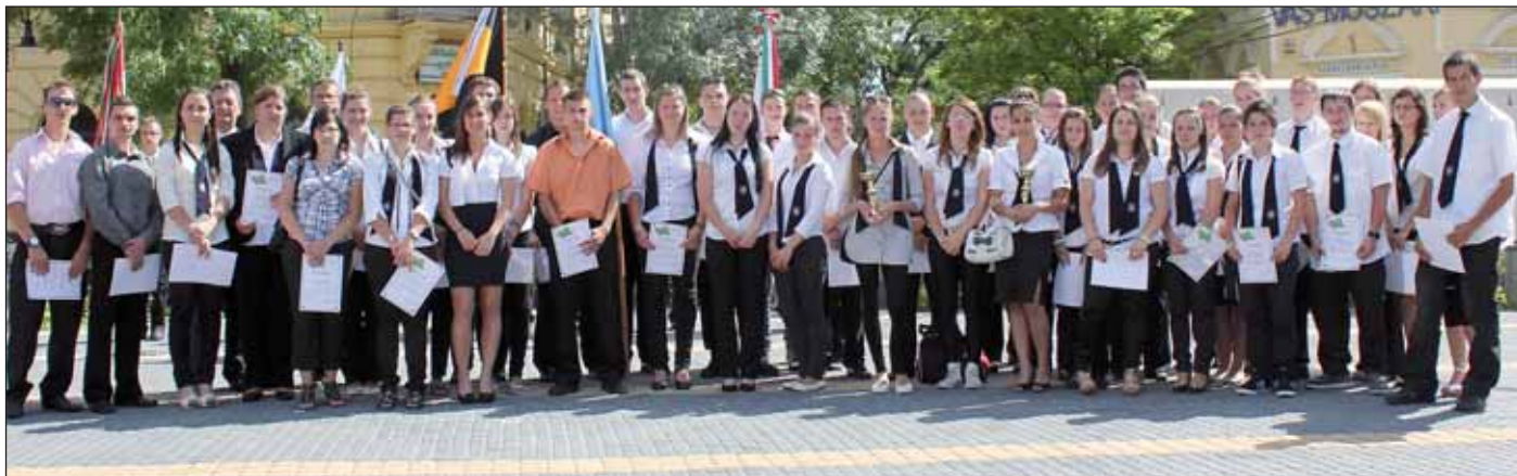
A Toldi Miklós Élelmiszeripari Szakközépiskola, Szakiskola és Kollégium kiváló diákjai