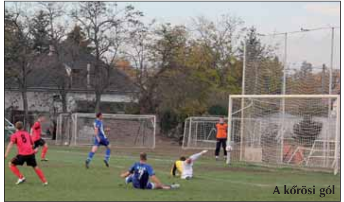
A kőrösi gól