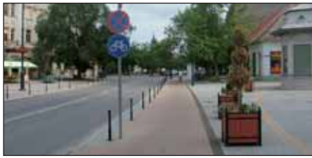
Másik irányból, MÁV felől a buszállomás felé, gépjármű és egyéb elosztás szerint, gépkocsi, kerékpáros, gyalogos