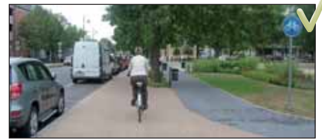
Szabályos kerékpáros közlekedés a MÁV felé