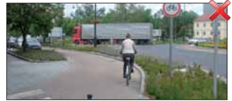
A DM üzlettől a művelődési házig kialakított útra a buszmegálló felől behajtani tilos