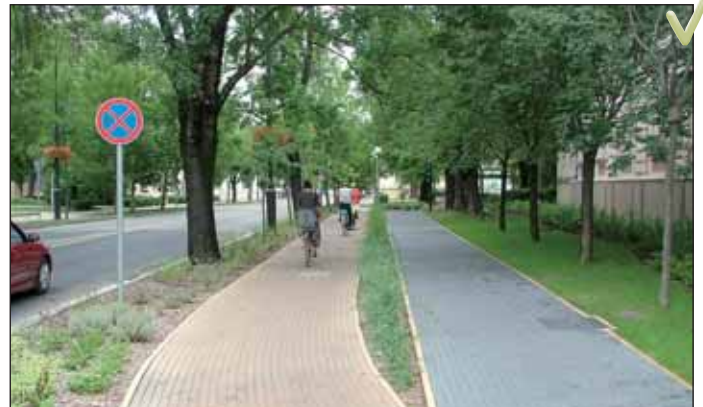
Polgármesteri Hivatal Ceglédi út felőli része, ugyancsak szépen látható, gépkocsi (Ceglédi út), kerékpáros (sárga út, de csak Cegléd felé szabályos), gyalogos (szürke út)