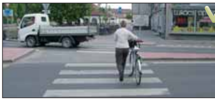
Gyalogosátkelőn tolni kell a kerékpárt