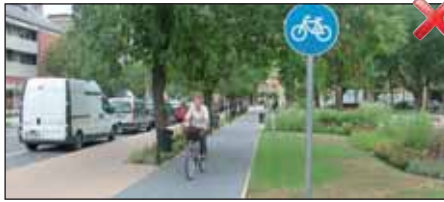
Szabálytalan, menetiránnyal szembeni közlekedés, valamint ezen terület a gyalogosoknak van kiépítve