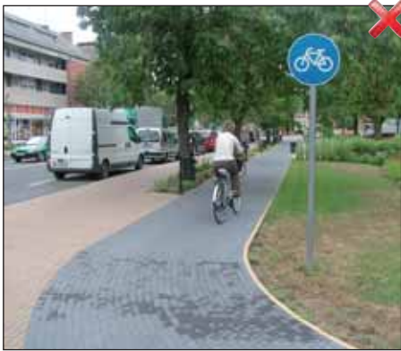
Sajnos ez a kép egy kis magyarázatra szorul, nem sikerült teljesen megfelelő helyre rakni az aszfaltozás miatt a „kerékpárút” jelzőtáblát, ez ugyanis a kerékpárúttól balra eső „sárga útra” vonatkozik, így a képen szabálytalan a közlekedés, mert az a gyalogosok részére szolgál „szürke sáv”