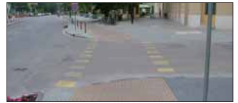
Postapalota előtti útkereszteződés, itt vehető ki legjobban, hogy a szaggatott sárga jelzés a kerékpárosok nyomvonala (csak a MÁV irányába szabályos), attól jobbra a szürke a gyalogosoké (mindkét irány szabályos)