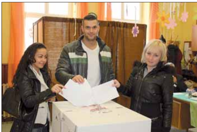
A város minden pontján, nemre és korra való tekintet nélkül, ezrek mentek el szavazni.