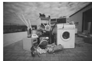
Nagykőrös, 2013. Március 14.

Akadályozzuk meg, hogy valamelyik árokparton, erdőszélen kőssenek ki ezek a berendezések, avatatlán kezek által szétcsedve, súlyosan szennyezve a talajt, a bennük lévő nehézfémektől és egyéb veszélyes kémikáliáktól.