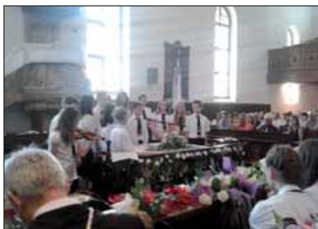
Ballagási ünnepség az Arany János Református Általános Iskolában