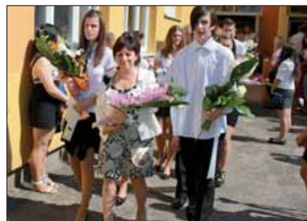
Ballagási ünnepség a Petőfi Sándor Általános Iskola és Kollégiumban