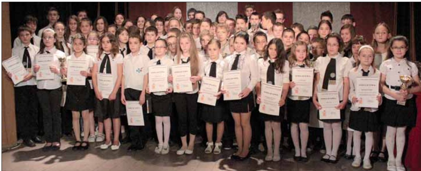
Az Arany János Református Általános Iskola kiváló diákjai