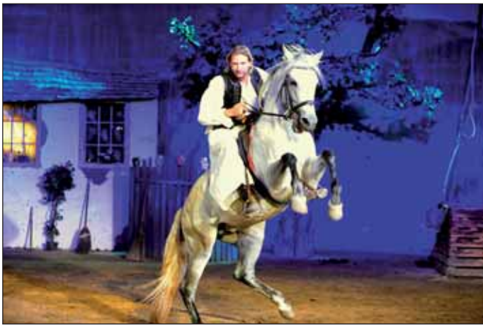
Pintér Tibor, a Nemzeti Lovas Színház igazgatója, színművész