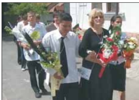
A Dalmady Győző Óvoda, Általános Iskola és EGYMI ballagási ünnepségén