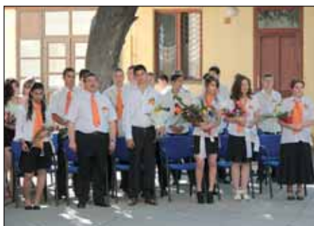
Ballagási ünnepség a Nagykőrösi Kolping Katolikus Általános Iskolában

Június közepén a nagykőrösi általános iskolák megtartották ballagási ünnepségeiket, van, ahol már a tanévzáró ünnepségre is sor került.