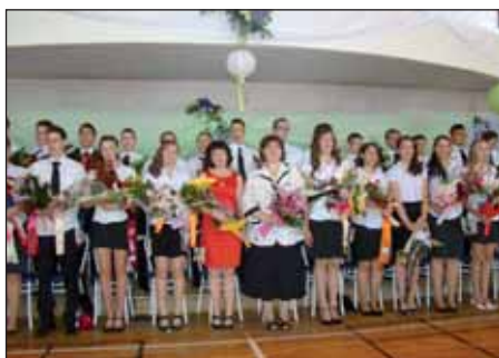
Ballagási ünnepség a II. Rákóczi Ferenc Általános Iskolában