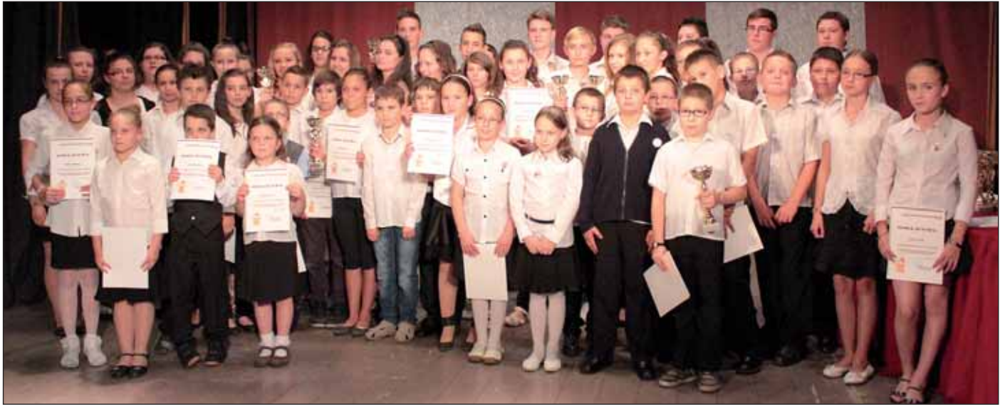
A Kossuth Lajos Általános Iskola kiváló diákjai