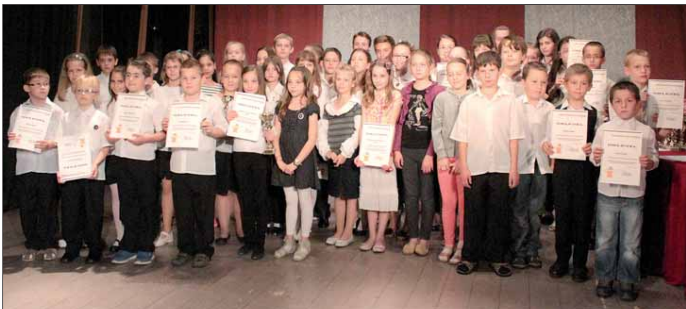
A II. Rákóczi Ferenc Általános Iskola kiváló diákjai