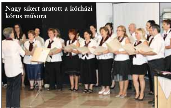
Nagy sikert aratott a kórházi kórus mősora