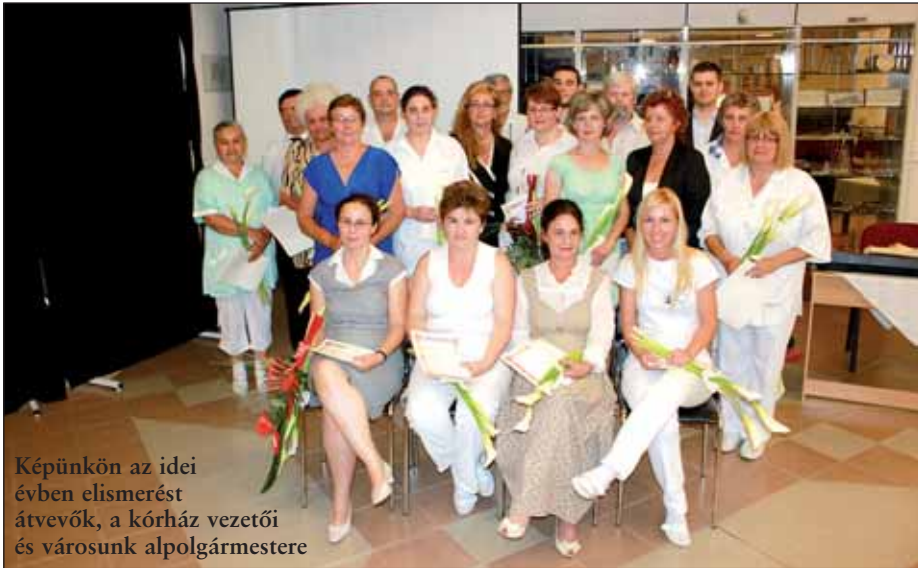
Képünkön az idei évben elismerést átvevők, a kórház vezetői és városunk alpolgármestere

A hagyományokhoz híven az idei évben is megrendezésre került a nagykőrösi kórházban a Semmelweis-napi ünnepség. A július 5-én, a kórház Fáskert utcai épületének emeleti aulájában megtartott ünnepi rendezvény keretében az intézmény közel húsz dolgozója vehetett át szakmai elismerést.